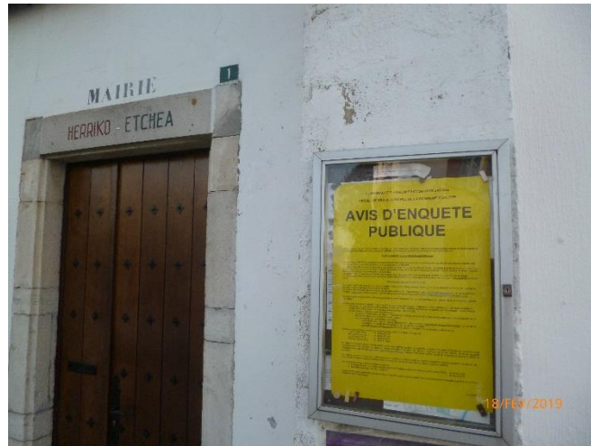
Mairie -1 place Mattin Trecu