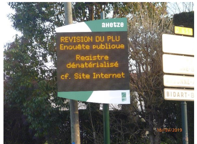
Panneau lumineux – chemin Ostaleriakoborda