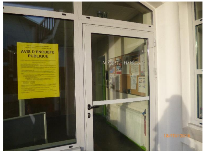
Espace Kultur Xokoa - 50 chemin Haroztegia