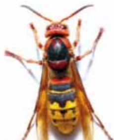
Frelon commun (jusqu'à 4 cm)